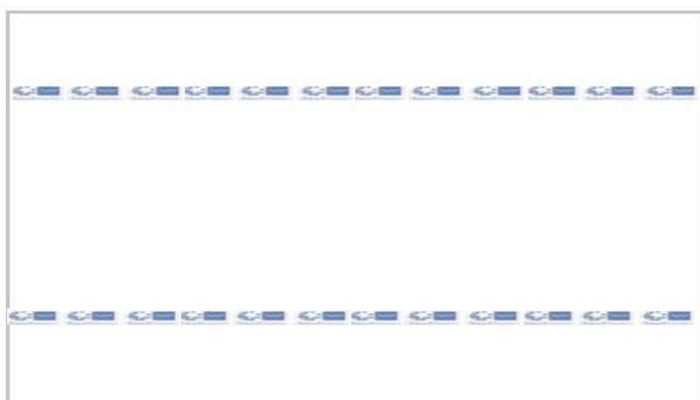
Imagen de la sábana de cama (tipo encimera):