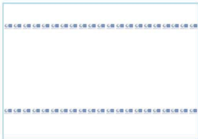
Imagen manta de cama: