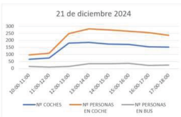
Tablas 1 al 6 y gráficos 1 al 6. Conteos realizados por el Servicio Móvil en Cañada Real en 2024.

En los conteos realizados, se observa que la hora de mayor afluencia de personas es en la franja horaria del mediodía, de 13.00 a 15.00 horas, acudiendo principalmente en coches particulares, donde viajan más de una persona. Según se observa en este estudio, el principal medio de transporte es a través de alquiler del viaje (en las ya referidas “kundas”) que llevan a la persona a que compre y consuma y vuelva a su lugar de residencia.