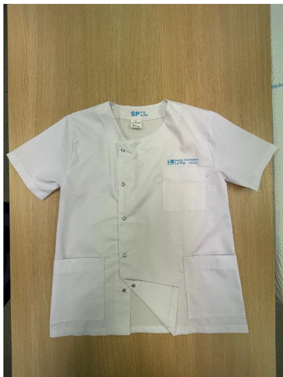
Imagen tipo del artículo: