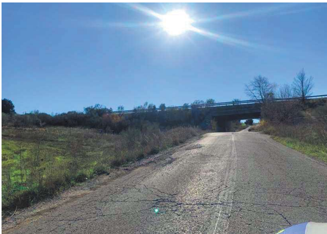
Ejemplo de firme en mal estado. Cruce con la R-5