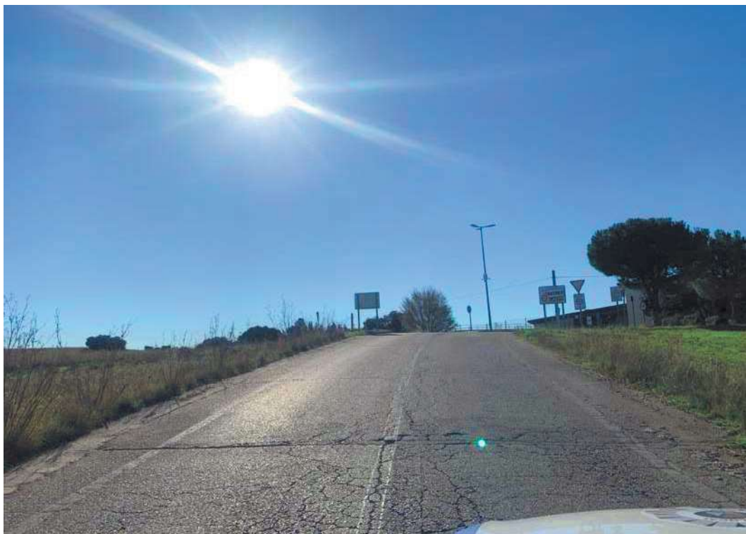
Tramo final: Urb. Cotorredondo y Montebatres. TM de Batres