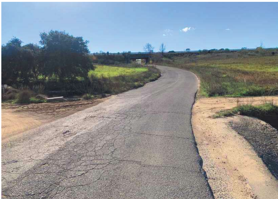
Ejemplo de firme en mal estado. Paso del arroyo de Torviscos