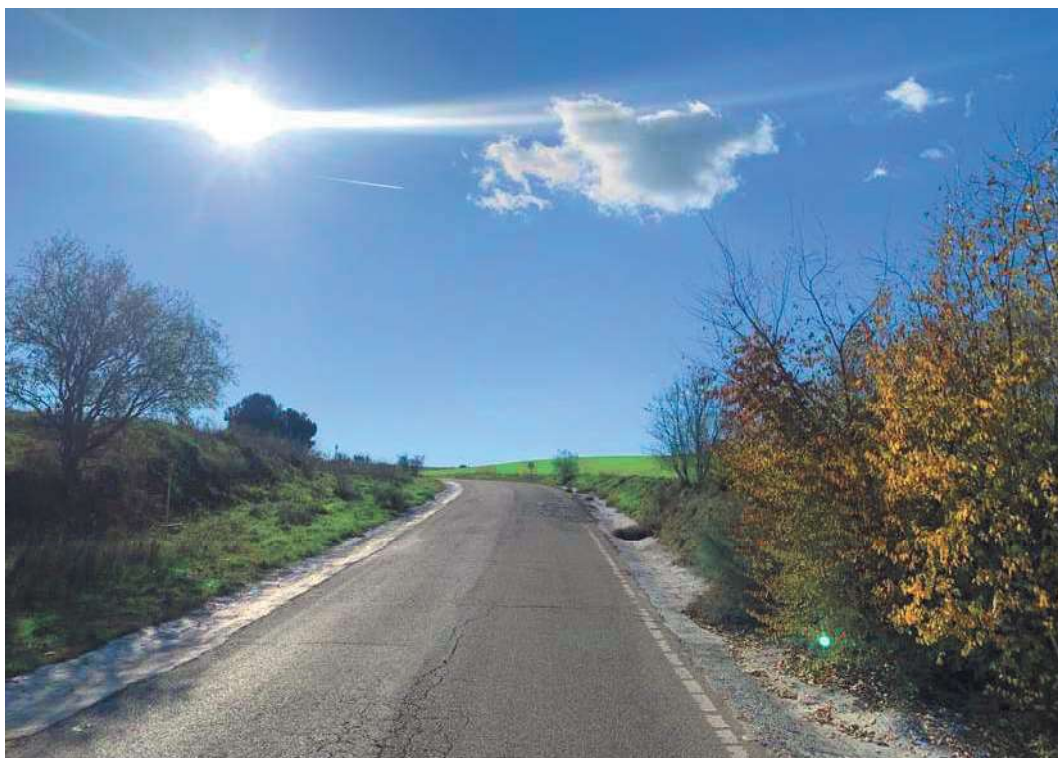
Ejemplo de firme en mal estado