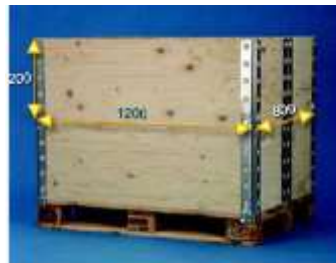
B. Contenedor montado.