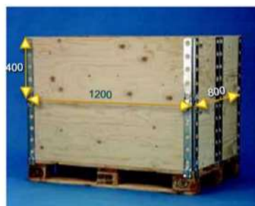
B. Contenedor montado.